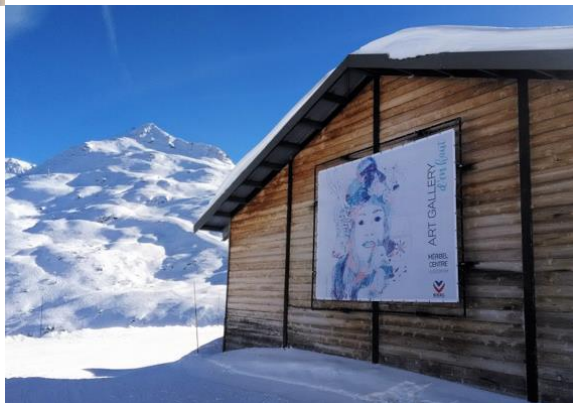
Art sur les pistes