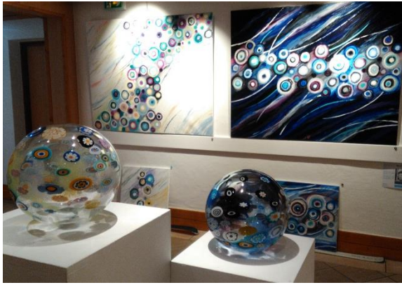
Exposition Art Gallery