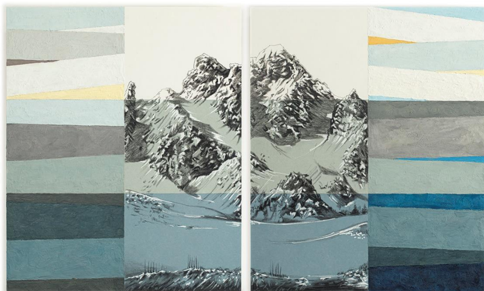
Dent de Burgin Méribel - Fabrice Nesta